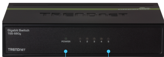
Illustration Eines Netzwerks

Die integrierte GREENnet Technologie reduziert den Stromverbrauch um bis zu 70%*