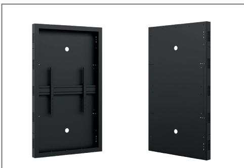
Optionale rückseitige Abdeckung verfügbar