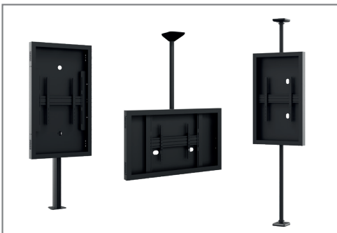
Kombinierbar mit Komponenten der CPS Serie