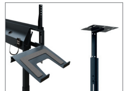
erweiterbar mit Laptop- / Kamera-Aufnahme