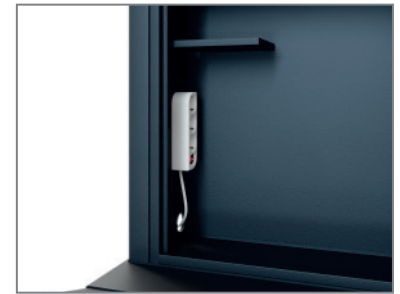
inkl. Mehrfachstecker und Ablage