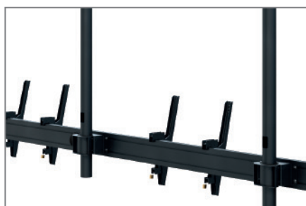
Anpassbar dank modularer Bauweise