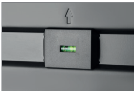
integrierte Wasserwaage für eine präzise Ausrichtung des Bildschirms