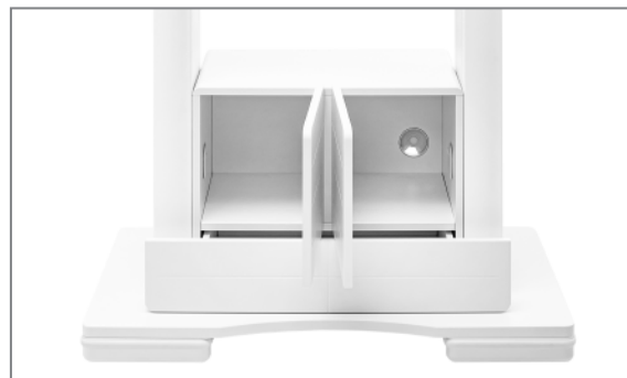
Gut strukturierter, belüfteter Stauraum für Medientechnik