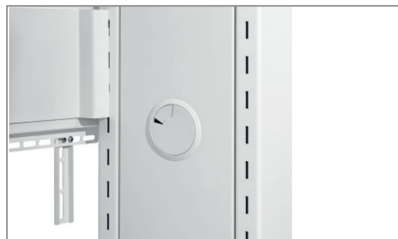
Höhe des Bildschirms wählbar in Raststufen (montageseitig)