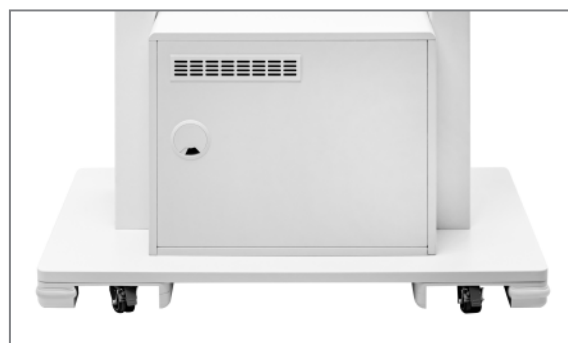
Rückansicht, feststellbare Transportrollen, Belüftungsgitter