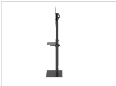
asymmetrische Bodenplatte erlaubt eine Positionierung nah an der Wand