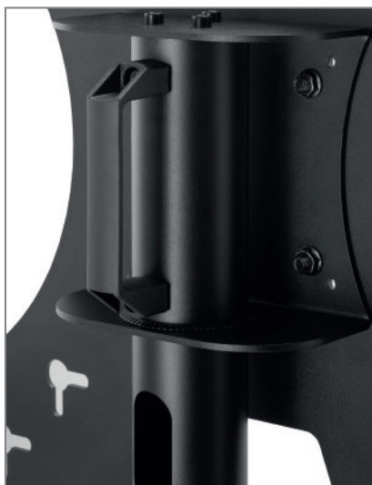
inkl. Griff auf der Säulenrückseite