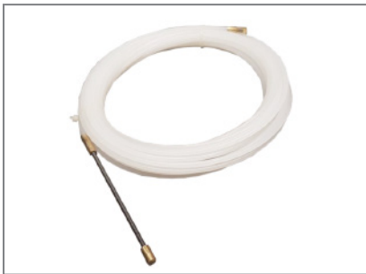
inkl. praktischer Kabeldurchzugshilfe