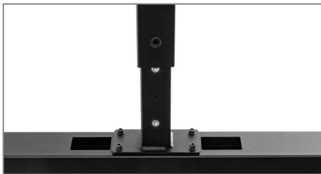
Höhenverstellung über montageseitig einstellbare Raststufen

Die Oberfläche ist im Standard schwarz und mit einer schlag- und kratzfesten Pulverbeschichtung veredelt. Auf Anfrage können auch andere Farbtöne (nach RAL) realisiert werden.