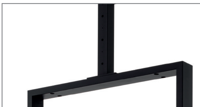
Kabelführung innerhalb des Rahmens