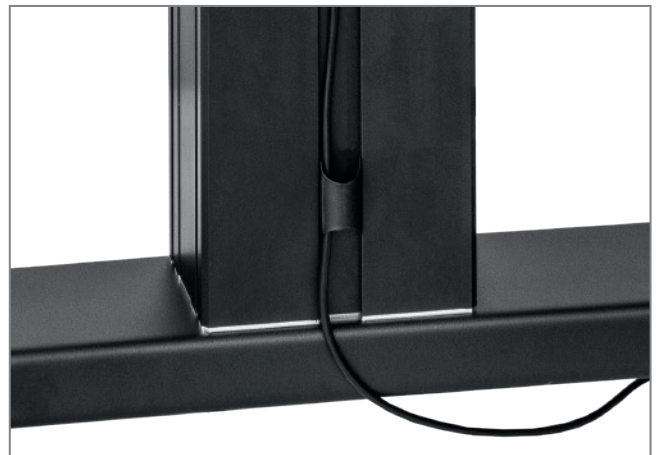
rückseitige Kabelführung durch Kabelclips