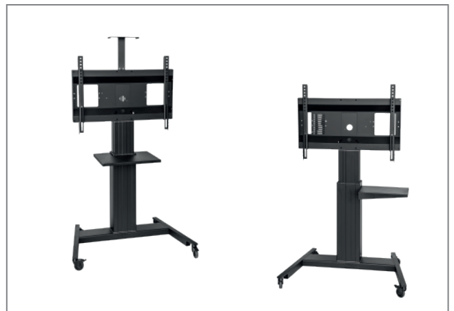
vielfältiges Zubehör, z.B. Front- und Sideshelf