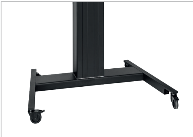
Mobile Lift Pro FLIP LP mit zwei feststellbaren Lenkrollen