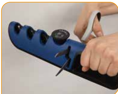
Auch ideal für das Schärfen von Scheren

Individuell verstellbarer Schärfer – ideal für Messer, Scheren, Gartengeräte uvm.