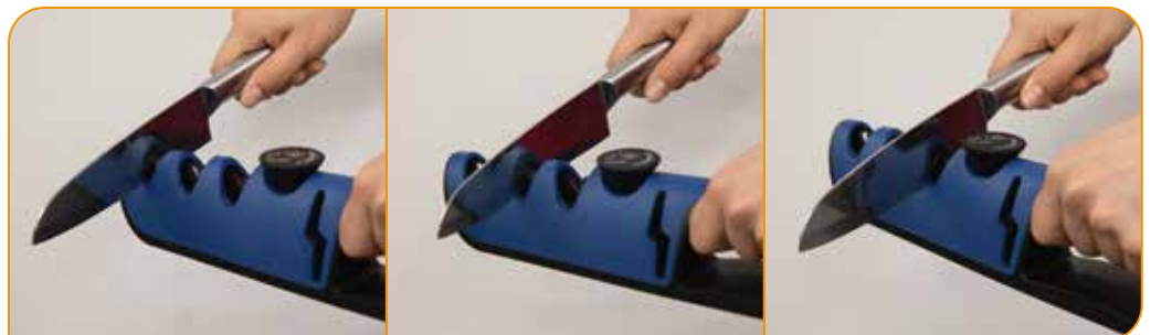
Revolutionäres 3-Stufen-System ermöglicht Grobschliff, Reparatur, Feinschliff und Politur mit nur einem Gerät