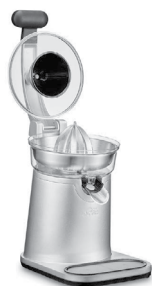
Verriegelungshebel offen: Der Hebel-Pressarm steht oben.